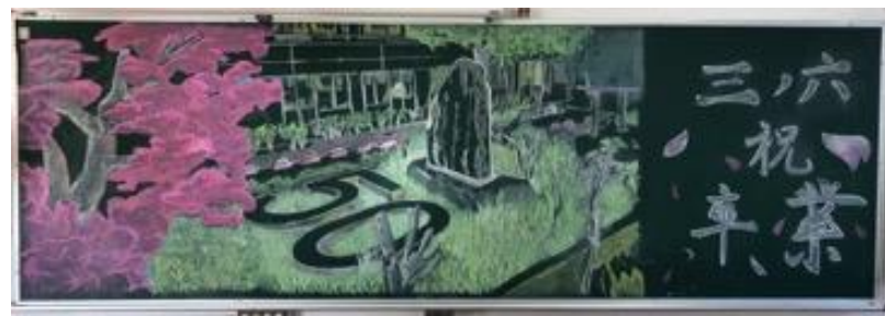
倉敷市立連島中学校(岡山県) 作品名：夢をもつかぎり 努力するかぎり 夢は遠くない