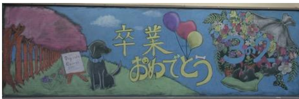
徳風学園徳風高等学校(三重県)

※2015プレ大会、2016大会では、応募時に作品名をつける規定がございませんでした。