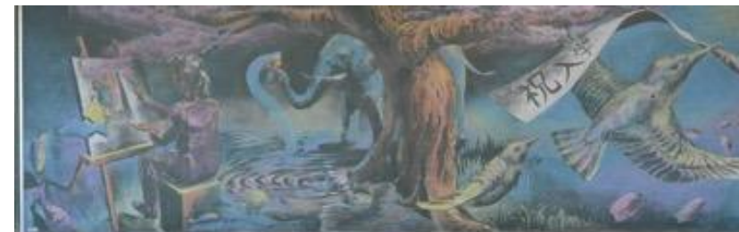
常葉大学附属菊川高等学校(静岡県) 作品名：広がる世界