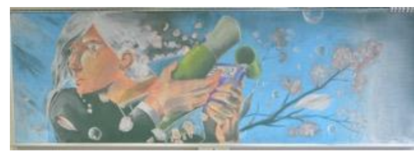
笹田学園向陽台高等学校(静岡県) 作品名：旅立ち