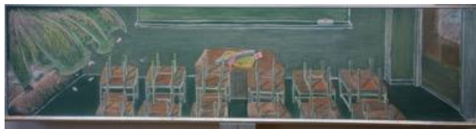
名古屋市立神の倉中学校／作品名：卒業式…