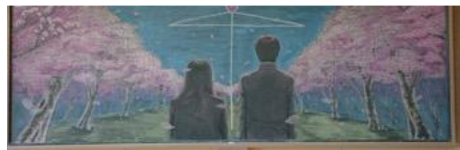
千葉県立安房高等学校 作品名：青春