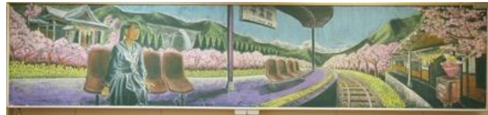
熊本県立大津高等学校 作品名：卒業駅