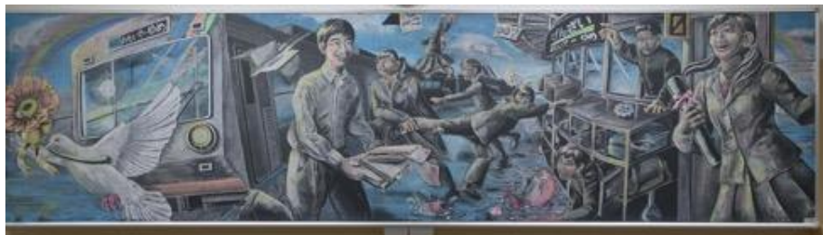
静岡県立科学技術高等学校