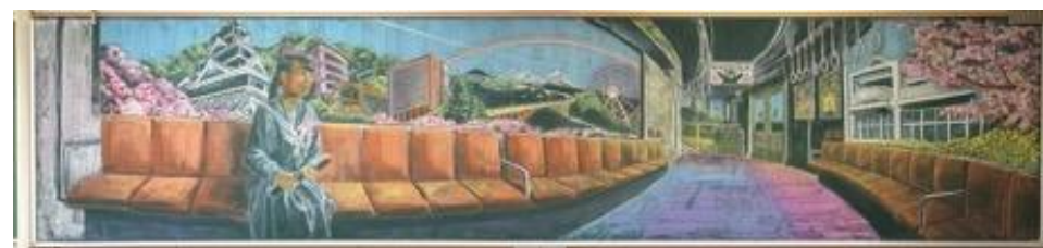
熊本県立大津高等学校 作品名：旅立ち