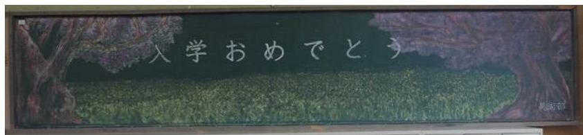
奈良県立生駒高等学校 作品名：入学おめでとう