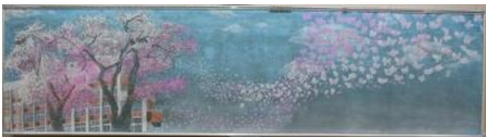
埼玉県立新座総合技術高等学校 作品名：Butterfly-桜-