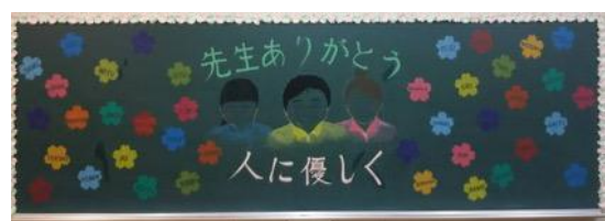
大阪市立生野中学校／作品名：卒業