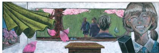
英明高等学校(香川県) 作品名：卒業