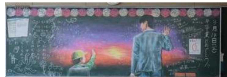
埼玉県立大宮光陵高等学校 作品名：僕はいま