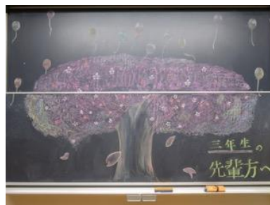
守谷市立愛宕中学校(茨城県) 作品名：旅立ちの桜