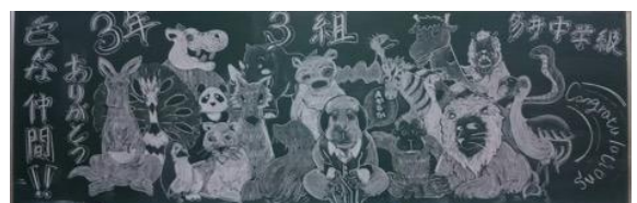
大阪市立生野中学校／作品名：卒業