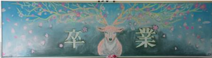
桜丘高等学校(三重県) 作品名：卒業をみつめる