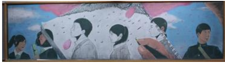
宮崎県立佐土原高等学校 作品名：描く未来の自分像