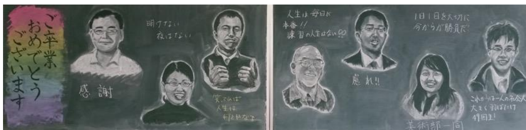
長崎県立佐世保西高等学校