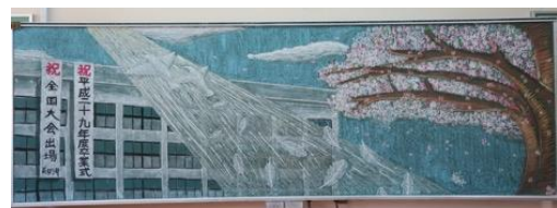
近江八幡市立安土中学校(滋賀県) 作品名：旅立ちの日