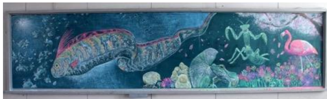
静岡県立掛川工業高等学校 作品名：gradation