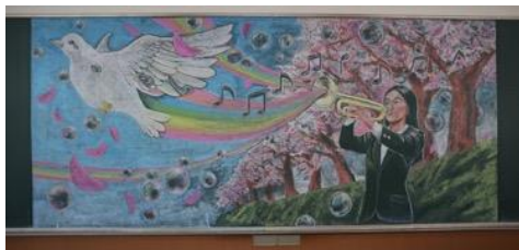
宮崎日本大学高等学校 作品名：青春と旅立ち