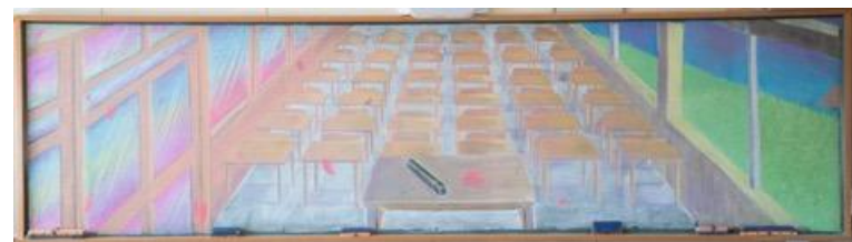
宮崎県立佐土原高等学校 作品名：卒業後の教室