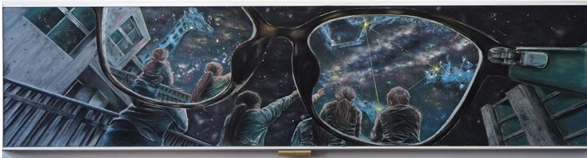
Nichigaku 日学・黒板アート甲子園®2021 最優秀賞 静岡県立浜松大平台高等学校 作品名:冬の幾何学