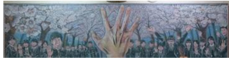
奈良県立郡山高等学校 作品名：思い