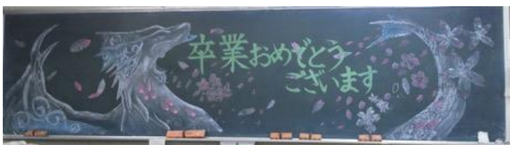
神奈川県立弥栄高等学校