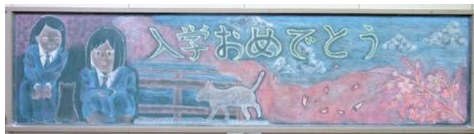
静岡県立浜松江之島高等学校 作品名：春の出会い