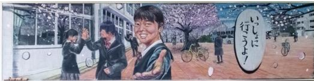
九州産業大学附属九州産業高等学校(福岡県) / 作品名：はじめよう