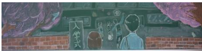
名古屋市立神の倉中学校／作品名：幸せの青い鳥