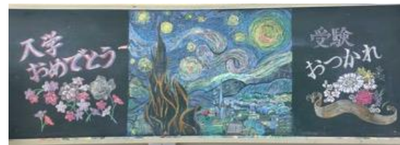
三重県立四日市高等学校 作品名：入学おめでとう