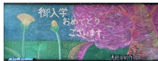
浜松市立三方原中学校(静岡県) 作品名：一步一步歩いていこう