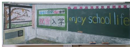
近江八幡市立安土中学校(滋賀県) 作品名：enjoy school life